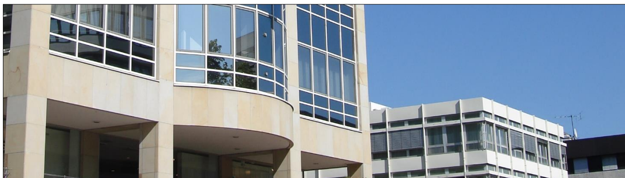
Östliche Karl-Friedrich-Straße 1-5, Pforzheim – ejendommen er afhændet!

Bestyrelsen i Kristensen Partners III A/S har dags dato afholdt bestyrelsesmøde, hvor koncernens halvårsrapport 2024 blev behandlet og godkendt.